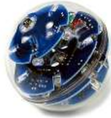
شکل ۱ - نمونه شکل داده شده

قرار دهید. یک نمونه شکل و نمودار در زیر آمده است: (توجه شود که شکل‌ها و نمودارها نیز، همانند جدول‌ها باید در موقعیت وسط‌چین نسبت به طرفین کاغذ و در جداولی با خطوط بی رنگ مطابق زیر قرار گیرند.)